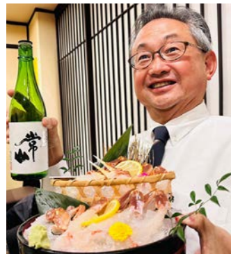
越前ガニとわたし

新年あけましておめでとうございます。 平素は弊社のサービスをご愛顧いただき、心より感謝申し上げます。昨年は5月にコロナ禍が一段落し、リアルコミュニケーションが多くなりました。リアルコミュニケーションとしてのワンショット「越前ガニとわたし」を掲載させていただきます。今年も充実した変革の一年を目指して参ります。さて、昨年は6月にBPOサービスのバックオフィス機能強化を目的に「BPOリンク大阪」を新設、また12月にプロダクション環境の機能強化を目的に「大阪本社」を大幅にリノベーションし、「新しい働き方」に対応したオフィス設計を行い、生産性の向上やリモートワークへの対応など、お客様から安心してご依頼いただける拠点の環境整備に注力した一年でした。何かの機会にご案内させていただきたく、是非ご来訪いただければ幸いです。今年も当社の3事業所（大阪本社・東京支店・BPOリンク大阪）を核に、環境変化への対応こそアピックスのDNAと信じて、お客様、パートナー、そして社員とともにお客様から必要とされるBPOサービスの向上と発展を目指し、お客様ならびに社会の発展に寄与してまいります。今年もどうぞ変わらぬご指導ご鞭撻のほど、伏してよろしくお願い申し上げます。